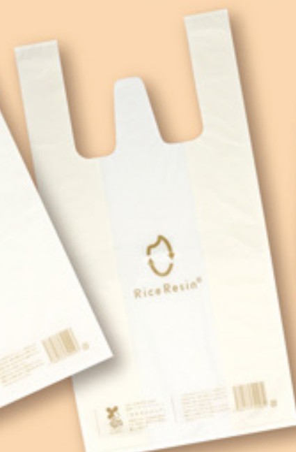
・ライスレジン規格袋 レジ袋 大

レジ袋タイプはテイクアウト等にぴったりで、 ごみ袋タイプは屋内外のイベント用におすすめです！