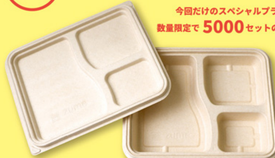
・ZM-バルブリッド 3区切りミールボックス用