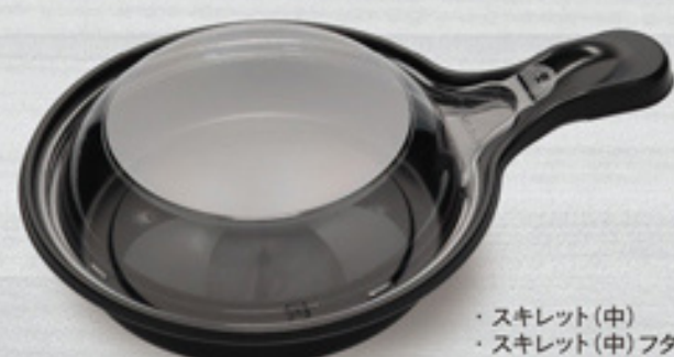
・スキレット(中) ・スキレット(中)フタ