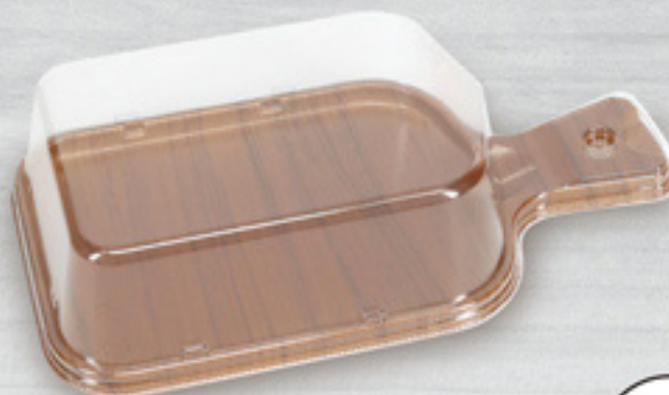
・カッティングボード本体 ・カッティングボードフタ

シックな木目調でカッティングボード型のデザインは 盛り付けるだけで料理をおしゃれにワンランクアップ！ サンドイッチ、おつまみなどにもオススメです。