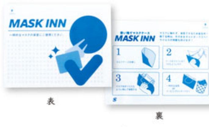
表 裏 マスク INN ブルー