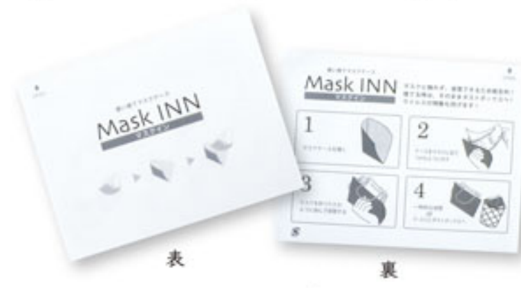
表 裏 マスク INN ブラック